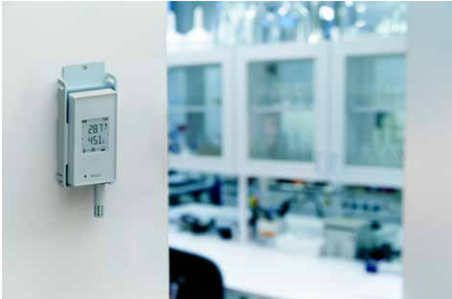
RFL 系列维萨拉 VaiNet 湿度和温度数据记录器

维萨拉 VaiNet 无线技术使用 sub-GHz 频率在环境监测应用中实现更好的信号传播。大多数配备无线设备的工业监测系统都采用某种冗余方式防止数据记录器网络中出现单点故障。VaiNet 通过在多个网络接入点之间分配信号负载形成冗余。接入点和数据记录器之间的无线信号强度决定了最佳数据传输路径。接入点利用以太网供电 (PoE)，从而减少布线，并且可以轻松连接到 UPS*。如果没有 PoE，则安装时提供单独的电源。此外，每个 RFL 系列数据记录器都是完全无线的，由电池供电，以确保系统在停电期间继续监测。如果无线网络掉线，每个记录器可以保留长达 30 天的数据，并且，如果以太网局域网出现故障，接入点将进行额外的数据存储。一旦网络恢复，数据记录器和接入点就会自动将所有历史数据回填到监测系统软件，以确保历史记录不间断。