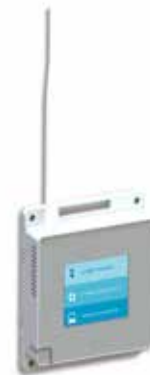
VaiNet 接入点允许用户从多达 32 个数据记录器收集实时数据。

维萨拉 viewLinc 监测系统利用基于 LoRa®* 技术的维萨拉 VaiNet 无线设备对环境条件进行无线跟踪。通过线性调频扩频 (CSS)* 信号调制, VaiNet 提供强大的通信, 在长距离范围内以及严酷、复杂和闭塞的条件下依旧非常可靠。长距离无线通信排除了运用中继器来提高信号强度的需要。VaiNet 的无线数据记录器以及接入点可进行预编程, 以相互定位并建立通信。更少的设备和配置让安装更加简单, 因此, 用户在缺乏联网监测系统的设置经验或者毫无经验的前提下也能进行部署。